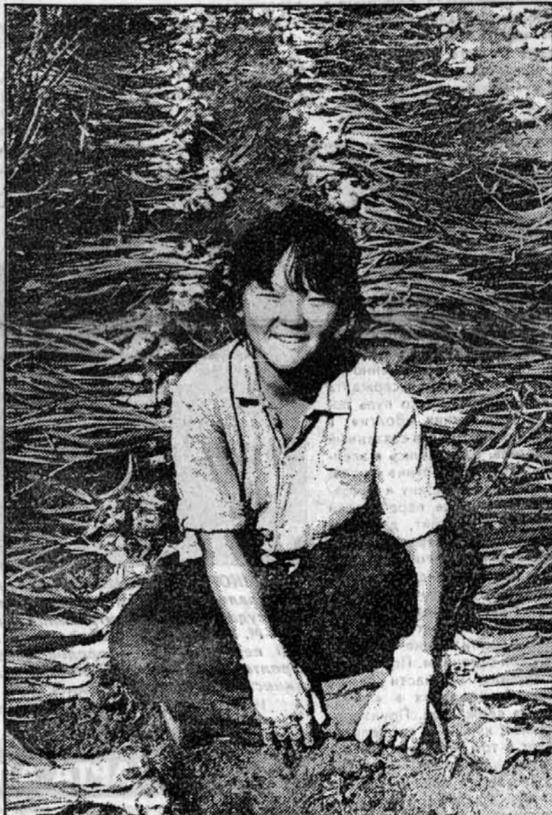
Рубцовский район.

Помню, года два назад в этом же хозяйстве корейцы подрядились выращивать арбузы. На четырех гектарах появились ровные длинные ряды посадок под пленкой. Весна оказалась холодной, а лето - засушливым и жарким. Надо было видеть овощи-