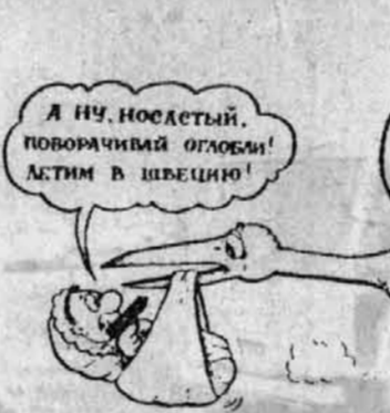
Рис. А. Маркелова.