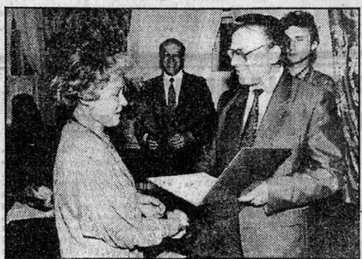
Не хлебом единым жив Барнаул