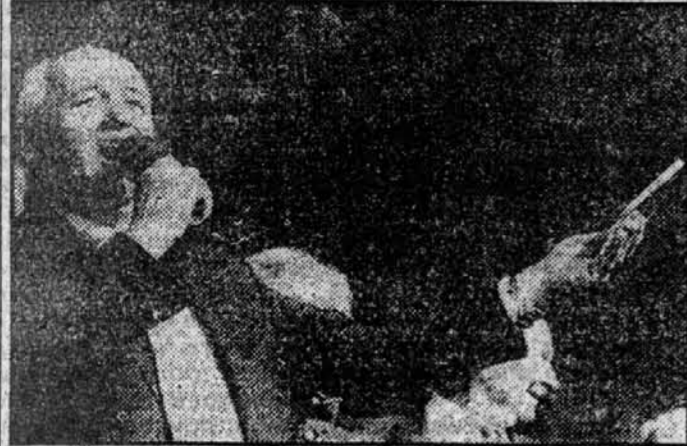
Михаил Горбачев, председатель экологической организации «Международный Зеленый Крест»...