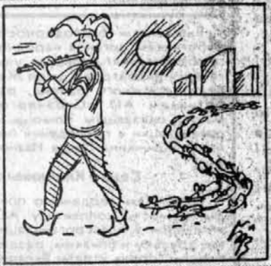
Рис. Владимира БРОВКИНА

Но мальчика, как известно, придумал сказочник Андерсен, что касается администрации, то она настроена реалистично и будет привлекать к ответственности. Краевой дезстанции разрешено отсрочить выплату Центробанку кредита в 110 млн. рублей на конец этого года. Деньги нужны для борьбы с грызунами.