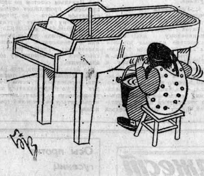
Нам рисует художник В. БРОВКИН.

Подписка на журнал продолжается до 1 марта. Ее можно оформить в книжном магазине (Ленина, 76, второй этаж). Цена подписки символическая — на год (четыре номера) — 200 рублей, на полгода — 100 рублей.