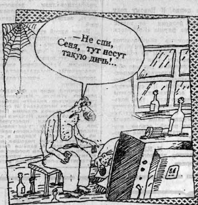
Рис. В. Шишова.