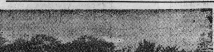
Первая обитанная «летающая тарелка» появилась на территории Германии в районе Франкфурт-на-Одере. По сведениям она велика. Дом внутригодовой формы высотой 6,5 метра, занимающий площадь 200 квадратных метров, смонтирован в деревне Вудков. По проекту местного союза «Экопайпер» здесь осуществляется моделирование экологически чистого населенного пункта. А эта «тарелка» предназначена для проведения разного рода мероприятий, и тем числе образовательного характера.

Первый зам. начальника Гохране РФ, а на их запрос об этом в МВД РФ (ведь клад положено слять в органы внутренних дел) никакой информации не получено.