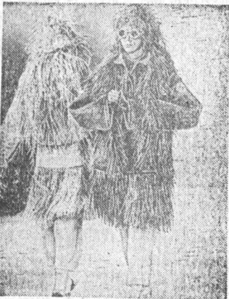
Очевидно, желанием быть ближе к природе руководствовался при создании этой модели японский модельер Исея Миягаэ.

ВОСЕМЬ мумий со светлыми или каштановыми волосами обнаружены китайскими и японскими археологами, которые исследуют сейчас развалины загадочного города Ния в труднодоступном районе гигантских пустынь Танг-ламах на западе КНР. Останки людей с ярко выраженными европеидными чертами дали новый толчок версии о том, что эта некогда процветающая станция на древнем «шелковом пути» из Европы в Восточную Азию была населена потомками солдат армии Александра Македонского, проникшими далеко на восток в IV веке до нашей эры.