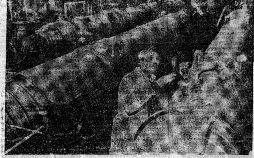
ПРОТИБНО. В Институте физики высоких энергий Министерства Российской Федерации по атомной энергии строится ускорительно-интегральный комплекс (УИИ). Проект немалая предусматривает сооружение двух ускорителей в одном туннеле. Хотя в США и Швейцарии сооружаются ускорители большой мощности, но программа исследования на УИИ будет просто уникальной. Поэтому ученые во всем мире, занимающиеся физикой высоких энергий, с нетерпением ждут пуска ускорительно-интегрального комплекса, чтобы принять участие в экспериментах. К настоящему времени выполнен большой объем работ. Завершена проходка кольцевого туннеля длиной 21 километр, изготовлено более 70 процентов электромеханического оборудования первой ступени УИИ, а также испытаны головные образцы сверхпроводящего оборудования второй ступени УИИ. Но в связи со сложной экономической ситуацией в России работы замедлились — не хватает денег. В этом году выделена только треть от той суммы, которая необходима для завершения работ. С каждым днем инфляционные процессы обесценивают и эти деньги. Поэтому строители не могут закончить строительство инженерных сооружений, а без них нельзя начинать монтаж физического оборудования. НА СНИМКЕ: стена испытания сверхпроводящих магнитов.