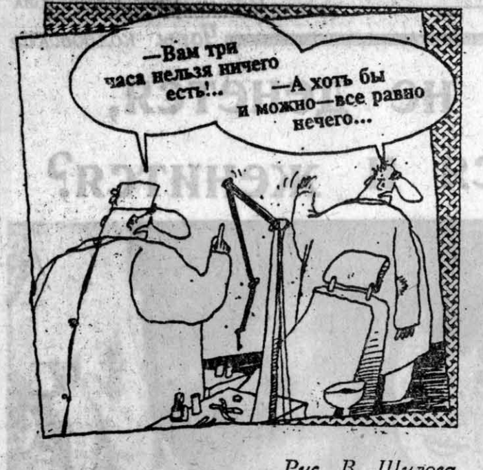
Рис. В. Шилюва.