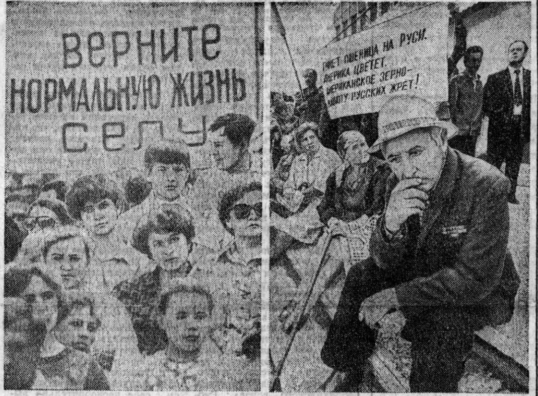
ВЕРНИТЕ НОРМАЛЬНУЮ ЖИЗНЬ СЕЛУ

Итак, в Залесском районе, откуда и пришла в Барнаул болезнь, на месте старых захоронений заболели в ту эпидемию животных прохладит