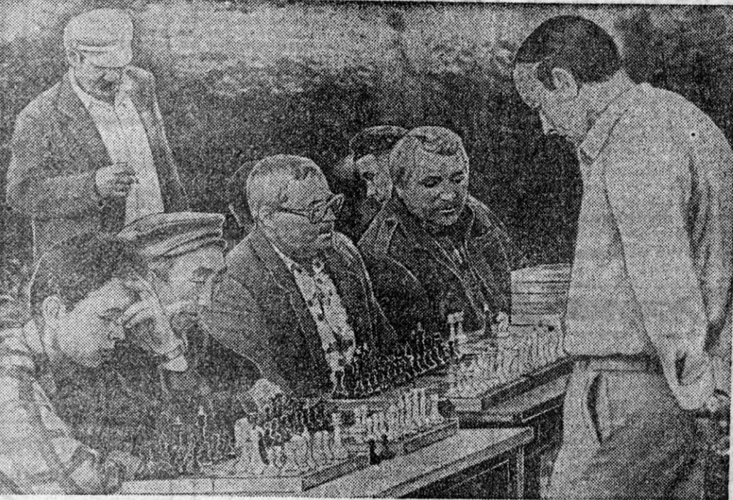
Практически все спортивные площадки Барнаула в День физкультурника были отданы в распоряжение спортсменов-любителей.

На швах одежды комаров менее всего привлекают зеленый, желтый, оранжевый.