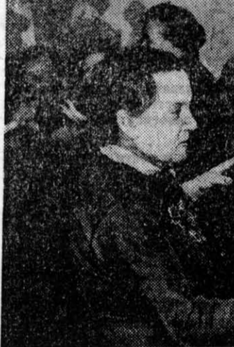
Стало доброй традицией проводить в Барнауле для ветеранов войны и труда вечера. Состоялась такая встреча в канун Дня Победы в Меландровском районе. Организаторами выступили администрация района, комитет по социальной защите и пенсионному обеспечению и другие организации. На этот вечер были приглашены участницы войны, войны погибших. Для них выступил театр «Напри», звучали музыка, стихи... НА СНИМКЕ: боевые подруги танцуют вальс.

В конце 1992 года комитет по труду с участием ученых изучил демографическую ситуацию в крае. По итогам изучения подготовили аналитическую записку. Вскоре на одном из заседаний совета администрации края она была рассмотрена при большом стечении должностных лиц.