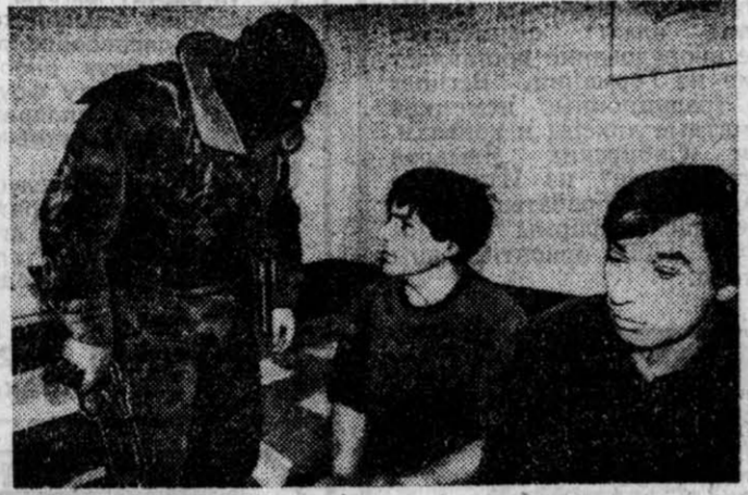
МОСКВА. Столичный ОМОН провел рейд по проверке режима проживания в московских гостиницах. На этот раз проверка проходила в гостинице «Салют». Изъято оружие и наркотики. НА СНИМКЕ: во время рейда.

На одиннадцать генеральных должностей в Ленинградском военном округе будут назначены женщины. Представительница прекрасного пола, видимо, возглавит военные комиссарияты Санкт-Петербурга и области, Мурманска, Архангельска и Вологды, а также некоторые управления штабов и соединений. Об этом решении стало известно при подписании итогов проверки войск ЛенВО, которую возглавлял министр обороны России Павел Грачев.