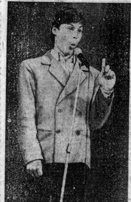
Горбачев, Ротару и другие