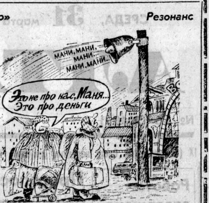
Рисунки Василия ДУБОВА.