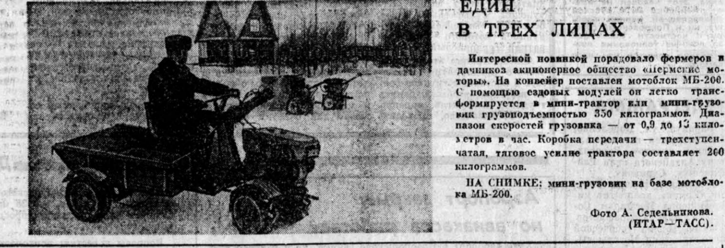
ЕДИН В ТРЕХ ЛИЦАХ. Интересной новинкой порадовало фермеров в дачном акционерное общество «Серебряный мотор». На колесном поставлен мотоблок МБ-200. С помощью садовых модулей он легко трансформируется в мини-трактор или мини-грузовик грузоподъемностью 350 килограммов. Диапазон скоростей грузовика — от 0,9 до 13 километров в час. Коробка передач — трехступенчатая, тяговое усилие трактора составляет 260 килограммов. НА СНИМКЕ: мини-грузовик на базе мотоблока МБ-200.