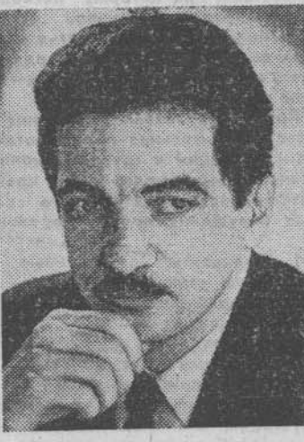
Беседу вел А. ШЕВЧУК.

авторских журналистских программ — как столичных, так и местных. Думаю, что соседство с американскими образцами поднимет их профессиональный уровень и конкурентоспособность. — Каким образом вы получаете запись из Санкт-Петербурга? — Самолетом. Двадцать четыре часа в сутки «4-й канал» принимает по спутнику телепрограммы, адаптирует для нас те, что положены нам по лицензиям, и отправляет кассеты в Барнаул. — Все бы ничего, но новости наверняка будут запаздывать... — Чем успешнее пройдет подписка, тем больше у нас будет возможностей самостоятельно принимать по спутнику и давать их прямо в эфир без предварительной записи на кассету. При таком варианте новости из Америки мы будем смотреть, опережая Москву на двенадцать часов. Для этого нужны большие деньги, сложная техника, но все это осуществимо, если Барнаул, Новосибирск и Красноярск, так сказать, вскакивают возмущают в аренду спутниковый ка-