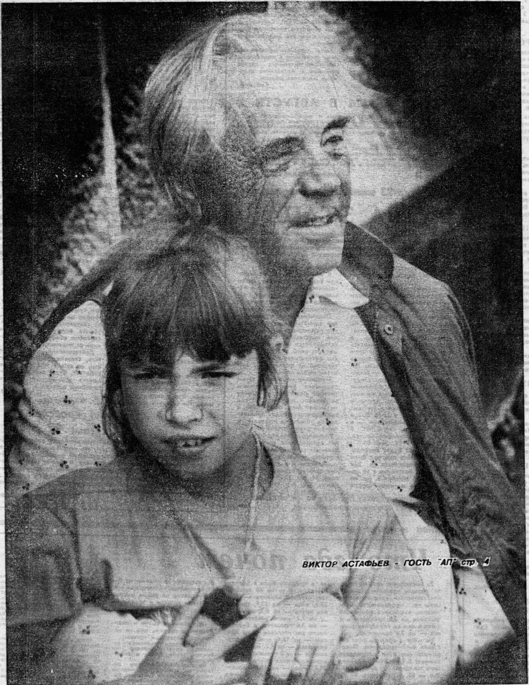
ВИКТОР АСТАФЬЕВ - ГОСТЬ "АП" стр. 4

1 августа 1992 г. — ВЫПУСК ВЫХОДНОГО ДНЯ — № 136—137