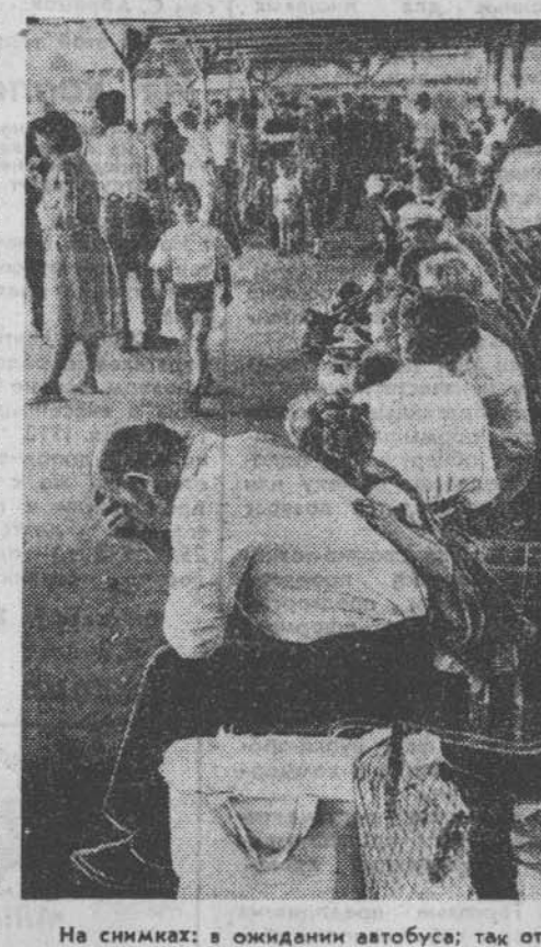
На снимках: в ожидании автобуса; так выглядят после рейса.