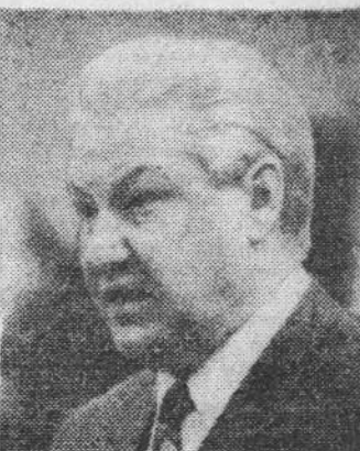
Президент России Б. Н. Ельцин.

Визит начался с возложения гирлянда цветов к мемориалу Славы на площади Победы.