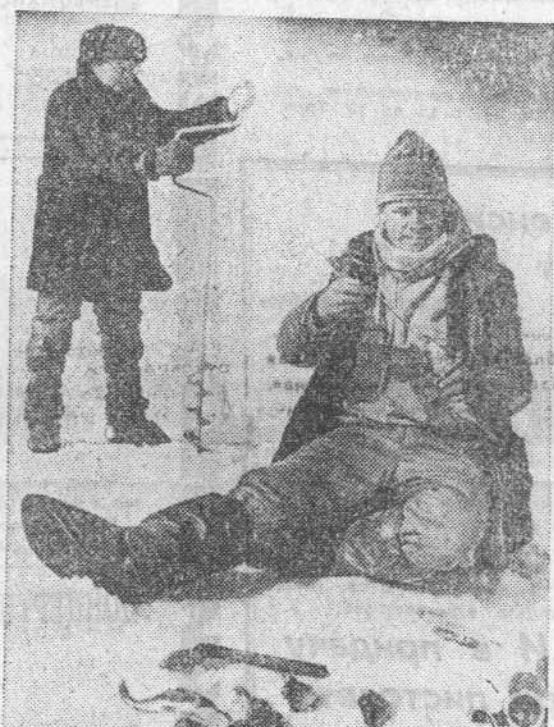
Третьяковский район.

В последнюю субботу марта на Гилевском водохранилище возобла авария стартовавшая ракета — начались краевые соревнования по подледному лову.