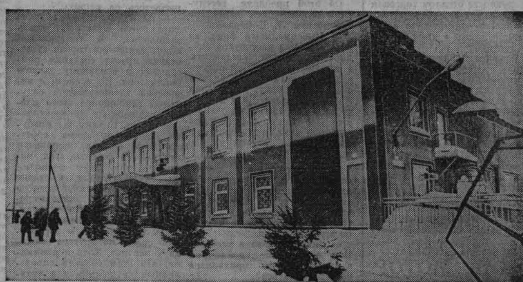
«КРИСТАЛЛ» ТРОИЦКИЙ ФИЛИАЛ

Сессия Заринского городского Совета приняла решение о создании в городе комитета по делам молодежи. В состав его будут входить четыре человека, они-то и попробуют решить весь круг вопросов и проблем, которые волнуют молодежь. Есть, например, такие должности, как социолог и коммерческий директор. Причем задача последнего — в течение года найти средства на содержание комитета. А пока об этом позаботится горисполком. Корр. «Алтайский правды»