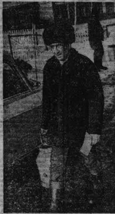
«БУДЕМ ДОНИТЬ АВТОМОБИЛЬ?»