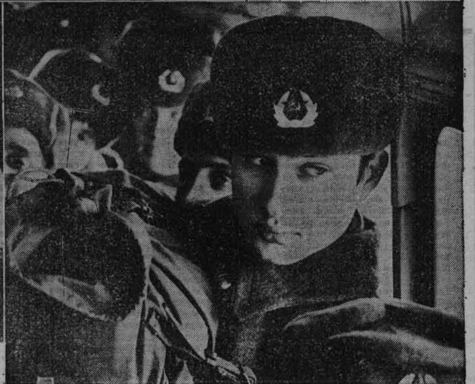
Фотовзгляд. Андрей Каспришин