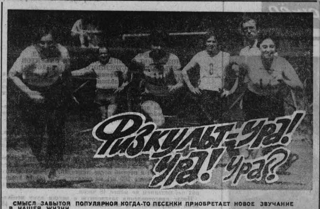
СМЫСЛ ЗАБЫТОЙ ПОПУЛЯРНОЙ КОГДА-ТО ПЕСЕНКИ ПРИОБРЕТАЕТ НОВОЕ ЗВУЧАНИЕ В НАШЕЙ ЖИЗНИ.

Известно, что здоровый человек работает лучше, дает больше продукции и высокого качества. И чем больше у нас будет здоровых людей, тем больше они произведут материальных благ. Но, к сожалению, эти истины, если не отвергаются совсем, то во всяком случае, не принимаются в расчет. И вот тому доказательство: в середине восьмидесятых годов — более свежих данных под рукой не оказалось — ежегодно в нашей стране стационарное лечение получали более 60 миллионов человек — примерно на каждый четвертый врач в больничных учреждениях регистрировал около 3 миллиардов посещений — более чем по десять посещений на каждого, а станции скорой помощи обслуживали более 80 миллионов человек — почти каждого третьего.