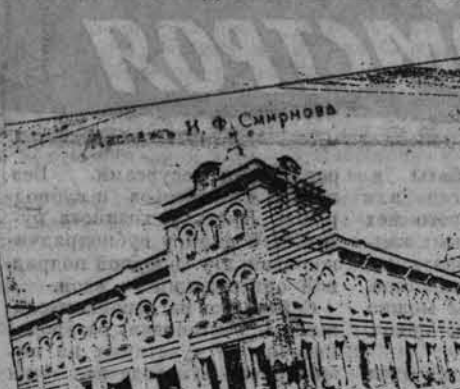
Адрес: г. Барнаул, ул. Чкалова, 34.