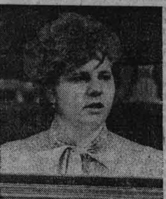
Уважаемые члены Политбюро и правительства! Кто же из вас сможет дать ясный, конкретный ответ жителям села — кормильца? Когда же будет положен конец разговорам, которые велуется годами, а десятилетиями воздуть дольщика сельского хозяйства и улучшения жизни крестьян? Если только в течение одного-двух лет не изменится отношение к деревне, некому будет работать, а значит, не будет ни мяса, ни молока. Хлеб некому будет выращивать.

Уважаемые товарищи делегаты! Я очень рада, что мне, простой рабочей, выпала такая честь — работать на XXVIII съезде нашей родной партии. Воспитывалась я в семье коммуниста, Старший брат и я уже сознательно вступили в партию, и мне до глубины души обидно, что так критикуют нашу партию, на нас, коммунистов, смотрят с осуждением. Чем же мы провинились? Или хуже работаем, или ведем себя недостойно? Считаю, что если кто-то незаконно пользовался привилегиями, то не место им в партии.