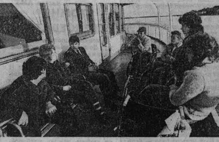
Фото-репортаж РЕЙС ВНЕ РАСПИСАНИЯ