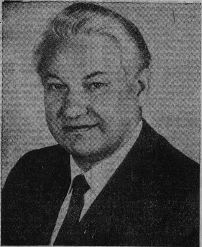
Борис Николаевич ЕЛЬЦИН

Съезд народных депутатов РСФСР постановляет: Избрать Председателем Верховного Совета РСФСР товарища ЕЛЬЦИНА Бориса Николаевича.