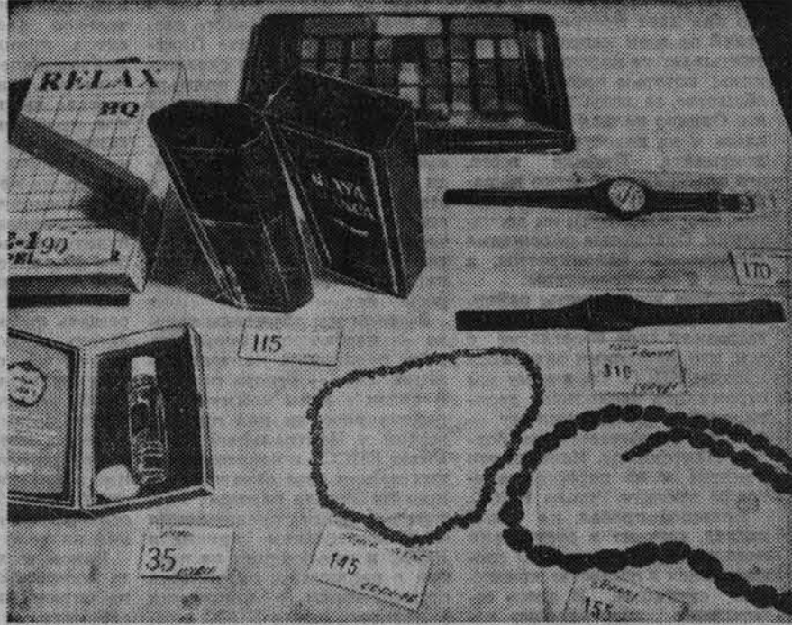
НА СНИМКЕ: КАК: в ходу в магазин; такие пока здесь прилавки.

Выходит, «Люкс» для покупателя — это «стакан черного рынка»? — С той разницей, что денежный привокор, и немалый, идет не только в карман спекулянтам — частникам, а в государство. И все же и цены ниже, чем на барахолке. К тому же есть отличные условия, чтобы не