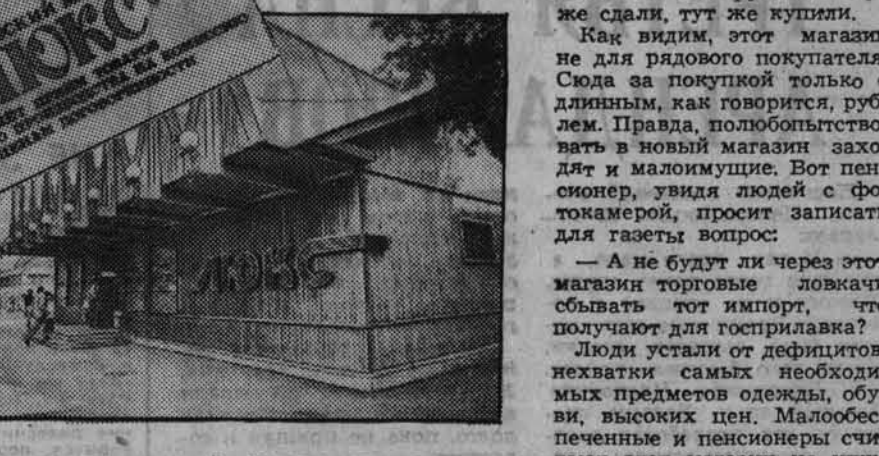
За неделю торговли выручка составила сорок тысяч рублей. В сравнении с другими магазинами Текстильшвейбульварга — это неплохо для начала. Вот только вчера продан корейский магнитофон за 2.800 рублей, бойко торговали французской туа-

летней войлой, а флакон стоил от 50 до 178 рублей. Были женские сапоги производства ФГТ за 270 рублей. Тут же слали, тут же купили. Как видим, этот магазин не для рядового покупателя. Сюда за покупкой только с длинным, как говорится, рублем. Правда, подобостыствовать в новый магазин заходят и маломужички. Вот пенсионер, увидя людей с фотоаппаратом, просит записать для газеты вопрос: — А не будет ли через этот магазин торговые ловкачи сбывать тот импорт, что получают для гостриплавка? Люди устали от дефицита, нехватки самых необходимых предметов одежды, обуви, высоких цен. Малобеспеченные и пенсионеры считают этот магазин не нужным. А с позиции предстоящего перехода на рыночную экономику его открытие — ко времени. Значит, у кого есть что продать и на что купить — вас ждет «Люкс».