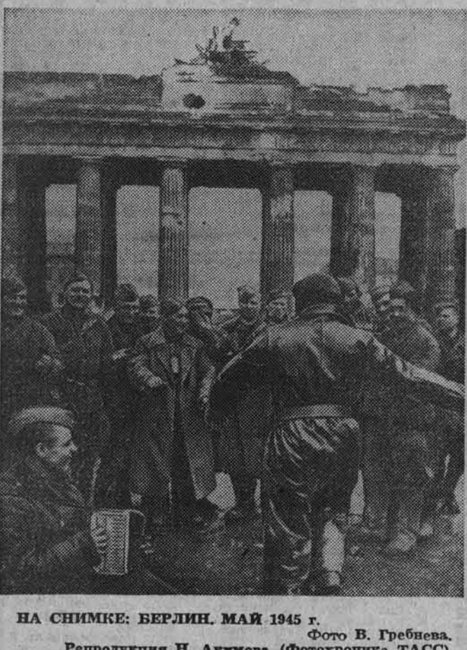
НА СНИМКЕ: БЕРЛИН, МАЙ 1945 г. Фото В. Гребнева. Репродукция Н. Акимова (Фотокроника ТАСС).