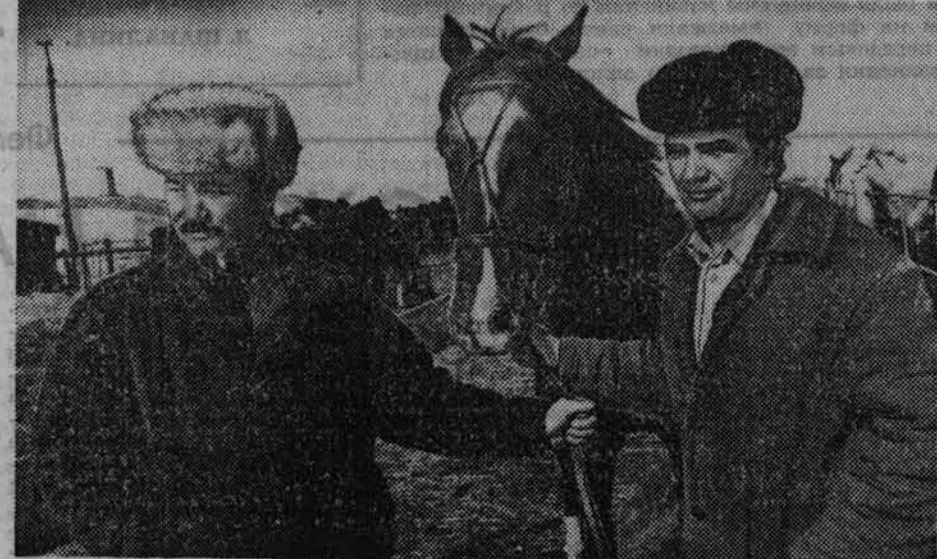
Родинский район.

им труженникам в ГПЗ «Родинский»; конюхи А. Зайко и В. Айдарханов; эти красавцы-кони занимают призовые места.