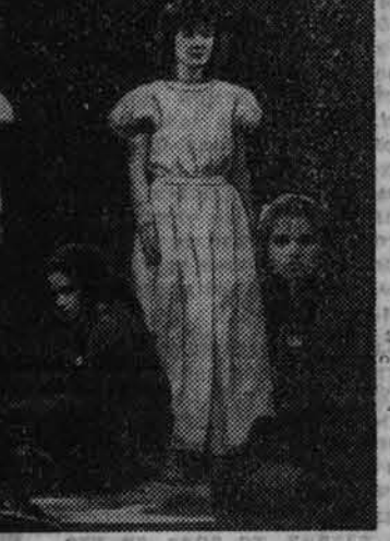
Заканчивается очередной театральный сезон в ТЮЗе. Театр готовится к майским гастролям, пока к малым — в Байск.