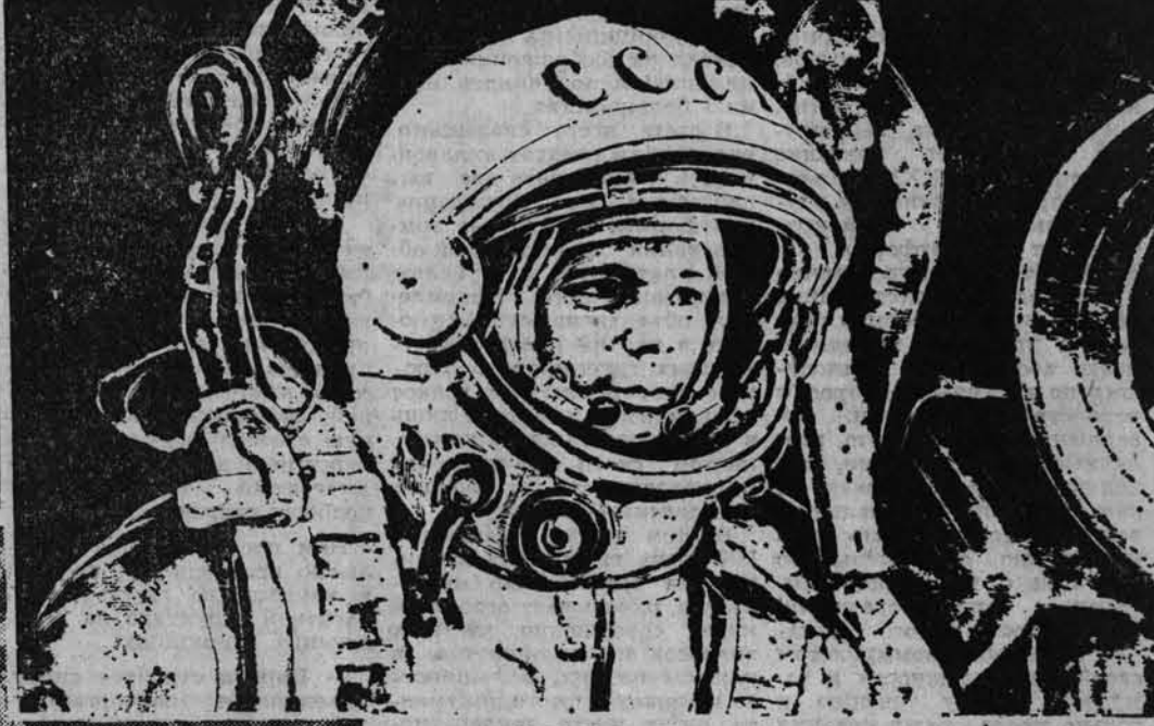
На снимке сверху: А. И. Плотнов. «Портрет Ю. А. Гаргарина».

ОМСК. Почти полвека действует в городе предприятие, до недавнего времени бывшее абсолютно закрытым для печати — ПО «Полюс».