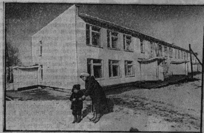
Детсад совхоза «Сибирские огни»

Недавно в «Алтайской правде» был опубликован фоторепортаж о социальном развитии совхоза «Заринский», ошибочно это хозяйство было названо «Сибирскими огнями».