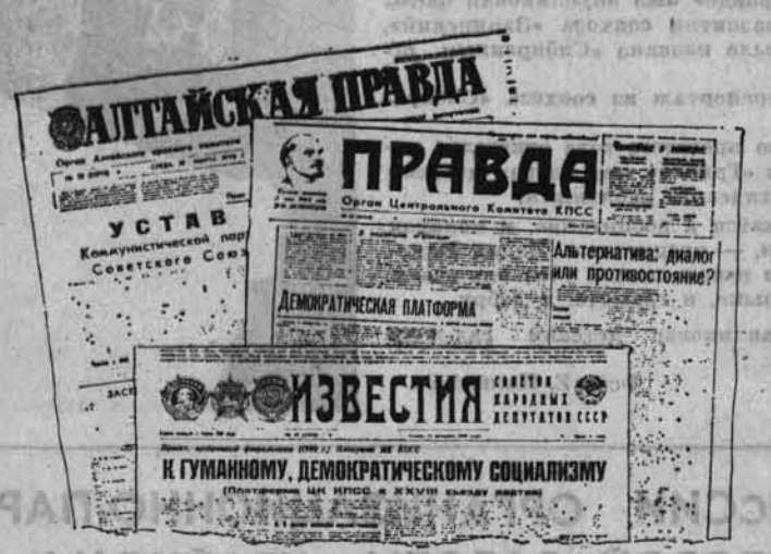
Участники прессклуба касались и организационных вопросов, таких, как сочетание централизма и демократии, гарантии реального подчинения Советов, и общих, теоретических (спор завязался, в частности, вокруг самого понятия «партия»). Про звучали и конкретные предложения по внесению изменений в обсуждаемые документы.

Конечно, в одном, даже продолжительном разговоре невозможно исчерпать весь спектр проблем, которые ставятся в обсуждаемых документах. На заседании прессклуба аудитория специально, по признаку единомыслия, тоже не формируется — приглашаем всех, кто испытывает потребность сверить позиции, поразмышлять, поспорить. Так что дискуссия проходила остро, высказывались различные, порой крайние точки зрения. Мы не считали возможным «не заметить» мысли, которых не разделяем. Хотя рамки газетной полосы позволяли ограничить заседание прессклуба лишь фрагментарно.