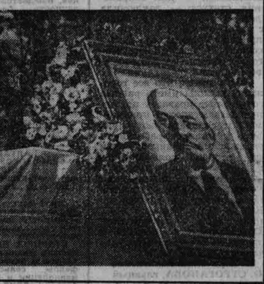
Благовещенский район.

Д ОМУ этому пошел 101-й год. Говорят, в его дружеских подвалах колчаевцы жестили арестованных. Об этом будто бы свидетельствовали пропавшие надписи на стенах.