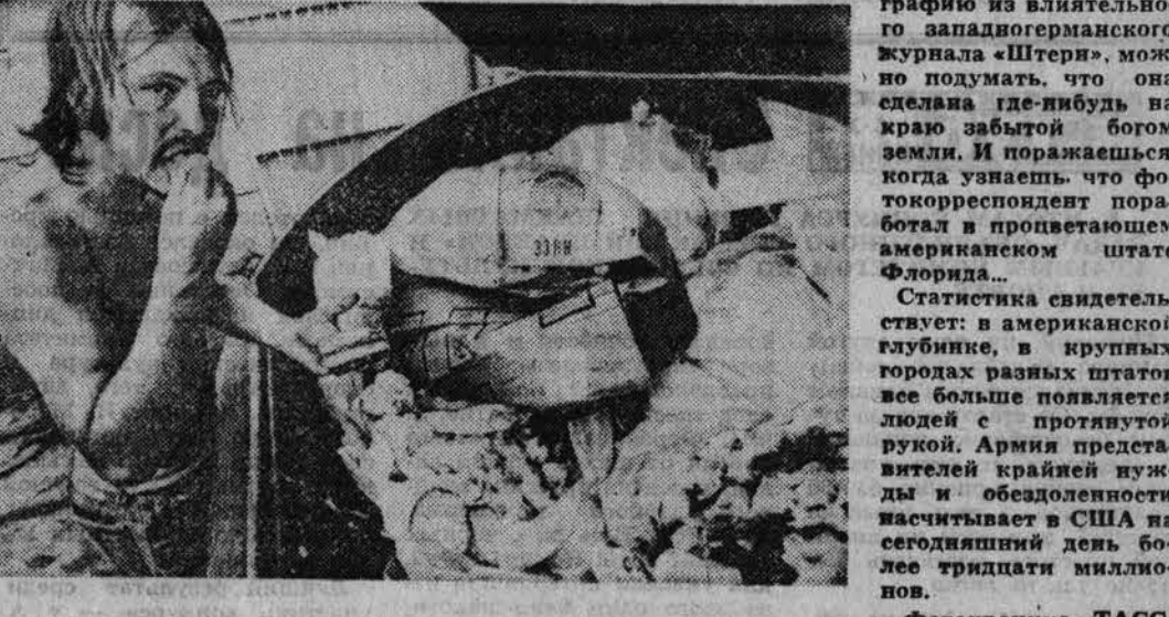
Глядя на эту фотографию из влиятельного западногерманского журнала «Штерн», можно подумать, что она сделана где-нибудь на краю заботой богом земли. И поражаешься, откуда узнаешь, что фотокорреспондент поработал в пролетающем американском штате Флорида...