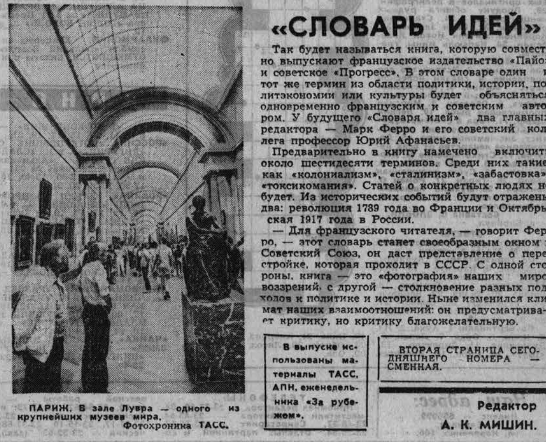
ПАРИЖ. В зале Лувра — одного из крупнейших музеев мира.