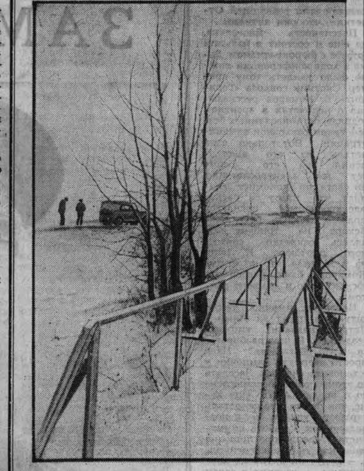
ПЕРВЫЙ СНЕГ.

Но 28 августа 1941 года совершенно неожиданно последовал указ о ликвидации республик немцев Поволжья с обвинением в шпионаже и возможном (?) содействии гитлеровцам, которые в то время были очень далеки от Волги. По этому указу все немцы Поволжья, а за ними и немцы Закавказья и других мест были выселены, практически сосланы, в Сибирь и в Казахстан. Вслед за этим немцы — военнослужащие были отозваны с фронта и отправлены в трудовые районы. Вскоре ту же были призваны все мужчины и бездельные женщины из немецких сел и из районов их выселения. Фактически