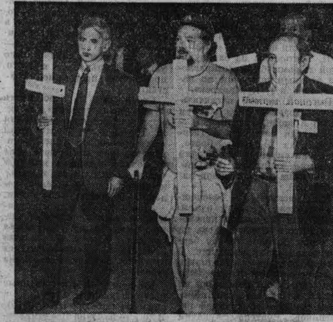
По просьбе читателей

Так называлась корреспонденция, опубликованная 15 сентября в «Алтайской правде».