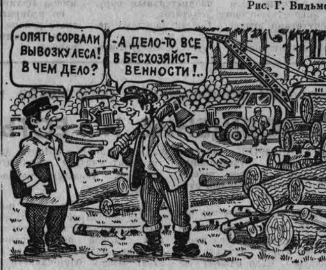
По материалам проверки. Рис. Г. Видьяшин.

Горно-Алтайский деспримхоз план по вывозке древесины, основному показателю своей работы, не выполняет. Узким местом остается вывозка леса. Сложилась порочная практика, когда заготовленная древесина ежегодно в больших количествах остается на деланках, подвергается порче. По данным бухгалтерского учета, на верхних складах остатки древесины составляют 4 тысячи кубометров. За это, а также за самовольный поруб, плохую очистку лесосек, недорубы и т. д. только в прошлом году выданы штрафов на 37.608 рублей.