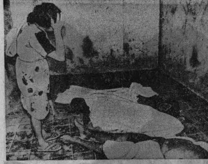
В Сальвадоре сохраняется напряженная обстановка. Режим Хосе Наполеона Дуарте, опираясь на поддержку США, продолжает вести иррегулярную гражданскую войну против собственного народа, которая уже унесла свыше 70 тысяч жизней.

НЬЮ-ЙОРК. С церемонии скандинавских песен и традиционной музыки в городе Су-Фолкс (штат Южная Дакота) открылся 43-й ежегодный съезд национального конгресса американских индейцев.