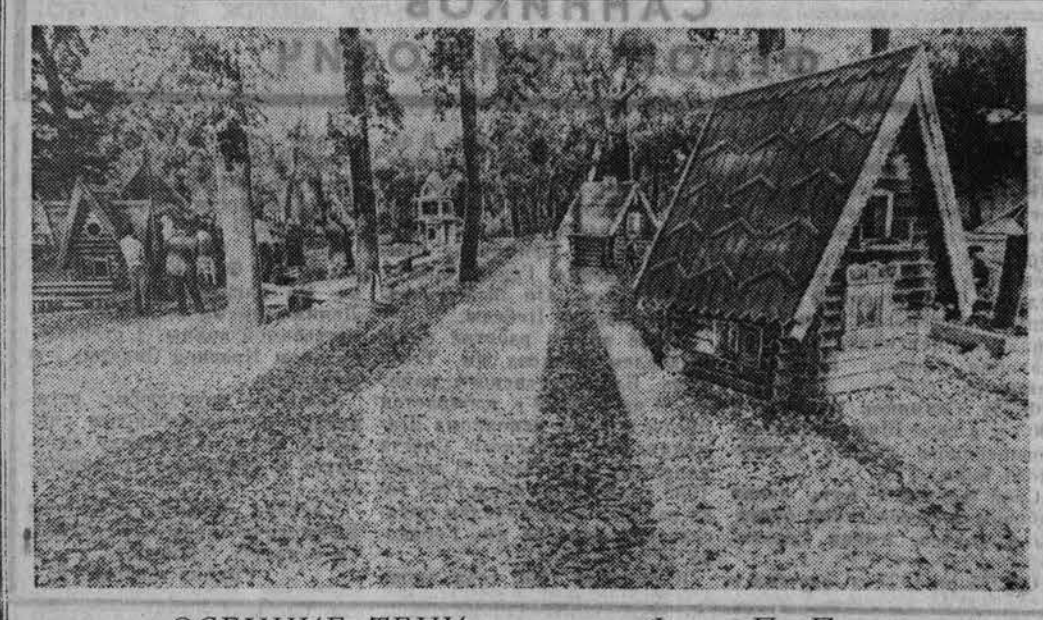
«ОСЕННИЕ ТЕНИ».

16 Октября ПЕРВАЯ ПРОГРАММА. МОСКВА 6.30 120 минут. 8.35 Футбольное обозрение.