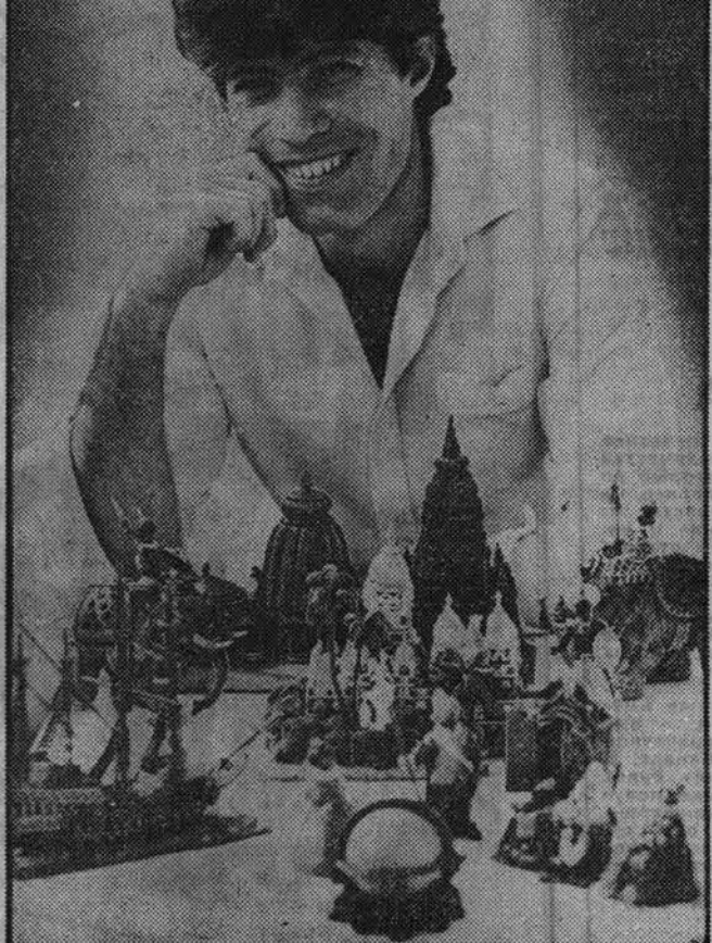
Мир творчества. Много лет ушло с того дня.

Наверное, они были тогда ладнее от совершенства, но в тот день свершилось чудо —