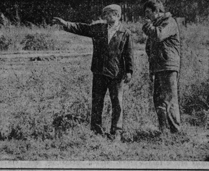
Панкруштинский район, Крутихинский район.