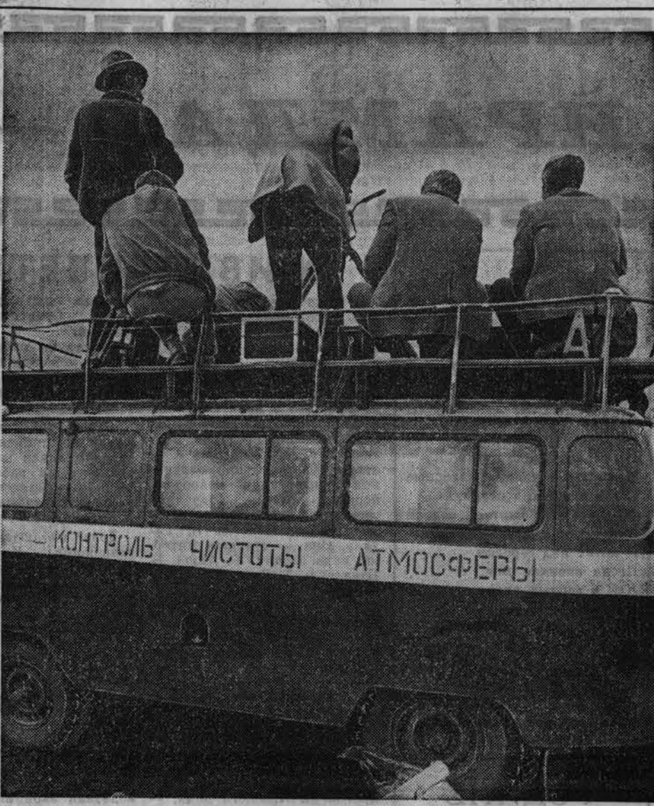
КОНТРОЛЬ ЧИСТОТЫ АТМОСФЕРЫ