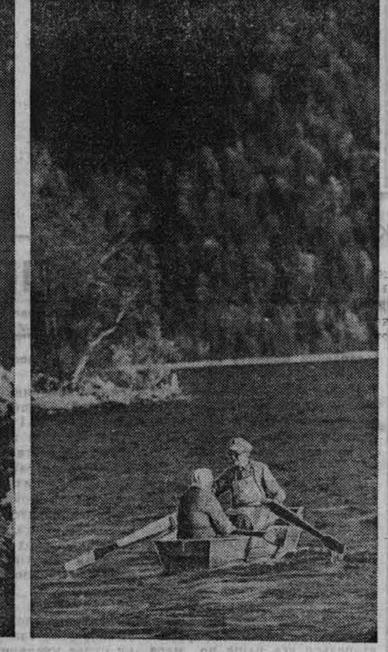
РЕПОРТАЖ ПРОСИЛ ЧИТАТЕЛЬ