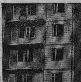
Сегодня — День строителя РАСТУТ ЭТАЖИ