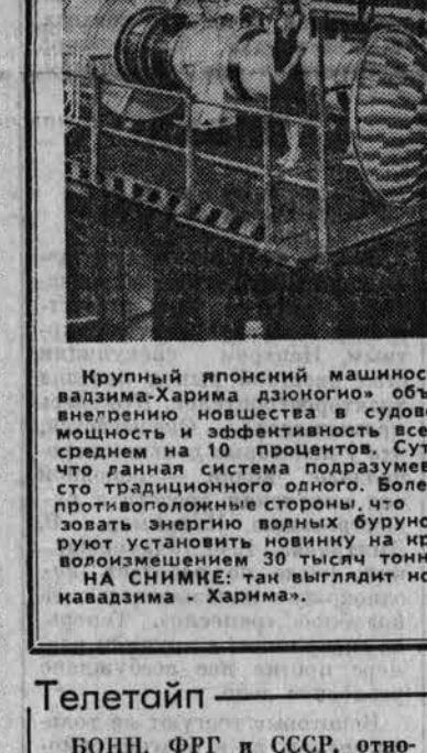
Крупный японский машиностроительный концерн «Исинава-Харима» объявил о завершении работ по созданию дизельного двигателя...

Состоялся концерт военно-патриотической песни, который привлек многих рубинских всех возрастов. Здесь же был организован сбор добровольцев на сооружение памятника — мемориала воинской интернационалистам.