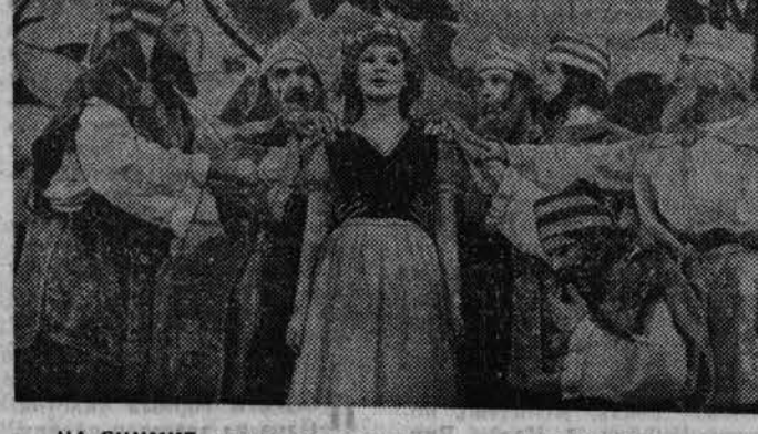
НА СНИМКЕ: сцена из спектакля «БЕЛОСНЕЖКА И СЕМЬ ГНОМОВ».