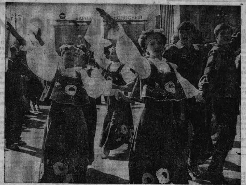
ФОЛЬКЛОРНЫЙ ПРАЗДНИК.