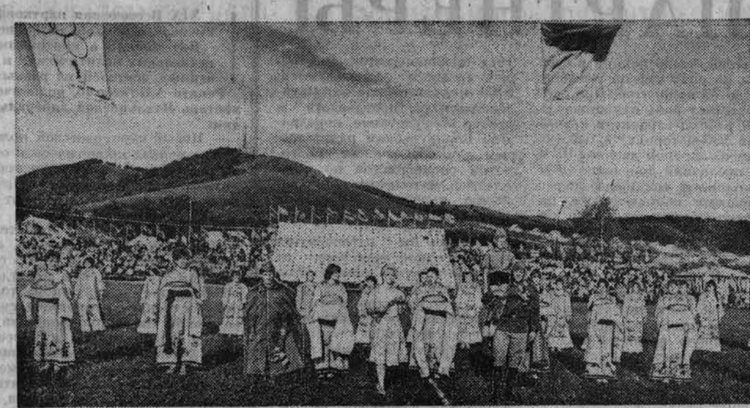
Победители соревнований в Соловешном.

Определение «массовость спорта» у нас порядком избито и нередко вызывает иронические усмешки, ибо, что греха таить, цифры в отчетах демонстрировали такое благополучие, что только диву даешься. Валовой показатель был самолюбивым. Доходило до смешного: удавалось какими-то уговорами, посулами вытиснуть человека раз на старт, чтобы тот одним толчком присутствием принес команде несколько зачетных очков, и его моментально записывали в графу сводки активно занимающихся спортом. Так искусственно росла армия физкультурников в районах края. Между тем по году на спортивных аренах делал один и тот же универсальный вид. Ситуация привычная, не новая она и по сей день.