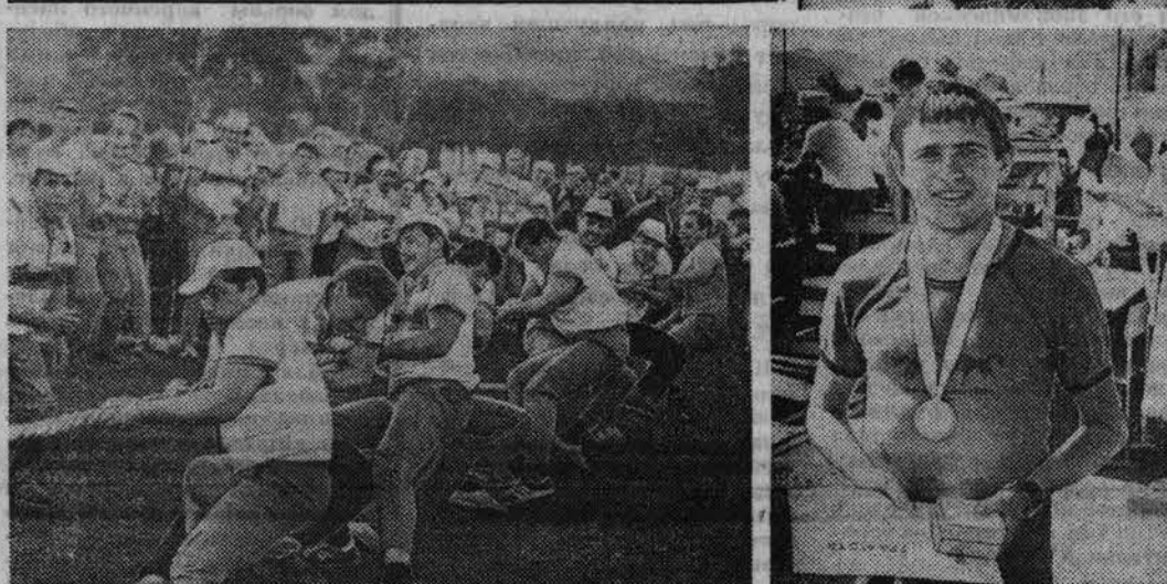
Однако в последнее время намелась иная подготовка, как и предложения съездить на зональные соревнования среди производственных бригад. По-прежнему выносятся и на районные старты, хочется не хвосты, а головы. Приходится готовить не десяток «железных» зачетников, а самостоятельные команды по каждому виду. Олимпиады, их красочность, торжественность настолько увлекают, захватывают, что за одним, пусть даже случайным выходом на старт, порой следует желание совершить регулярную подготовку, заниматься регулярно, а это как раз то, что надо.