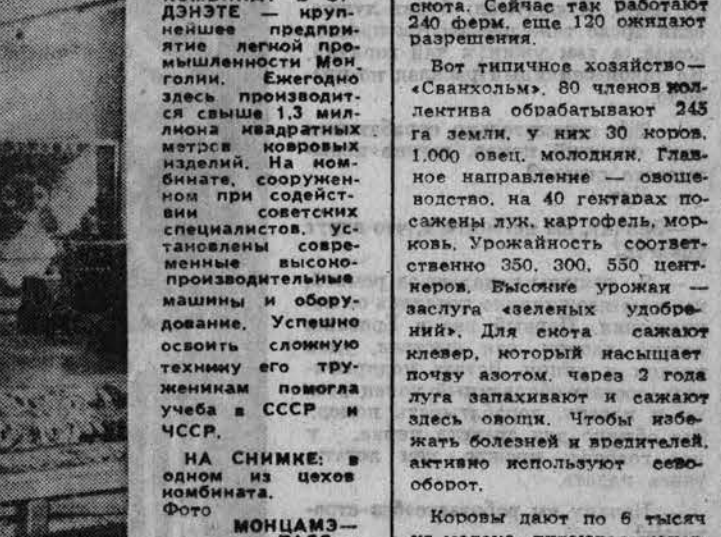
На снимке: в одном из цехов комбината.

Вот в рамках зимних каникул группа подростков проникла в Злыновскую среднюю школу и учинила там погром.