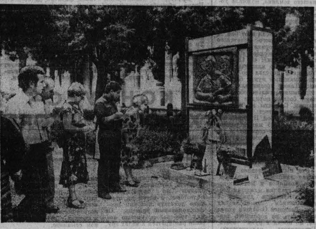
ГЕНУА. Имя Федора Полетаева — солдата Советской Армии, Героя Советского Союза, героя движения Сопротивления в Италии в годы второй мировой войны — известно всему миру. Он сражался в рядах итальянского партизанского движения и погиб в бою в 1945 году.

Федор Полетаев похоронен в городе Генуя на мемориальном кладбище «Стальное». У памятника герою — всегда живые цветы.